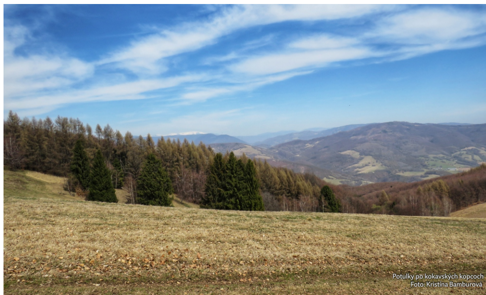
Potulky po kokavských kopcoch