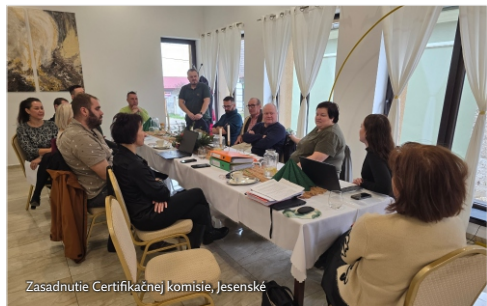
Zasadnutie Certifikačnej komisie, Jesenské

O udelení značky rozhodla Certifikačná komisia, ktorá zasadla 27. novembra 2025 v Jesenskom. Po posúdení splnenia stanovených kritérií odporučila udeliť značku ôsmim novým žiadateľom a zároveň schválila predĺženie platnosti certifikátu ôsmim dlhoročným držiteľom.