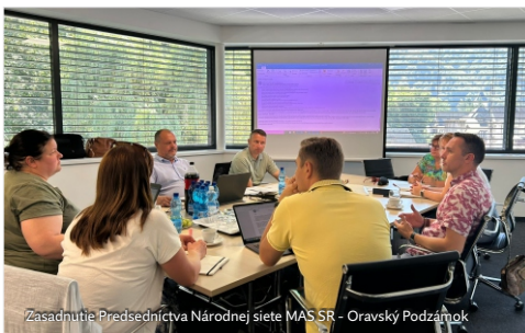
Zasadnutie Predsedníctva Národnej siete MAS SR - Oravský Podzámok