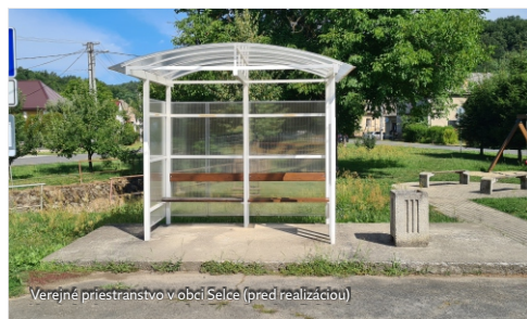
Verejné priestranstvo v obci Selce (pred realizáciou)