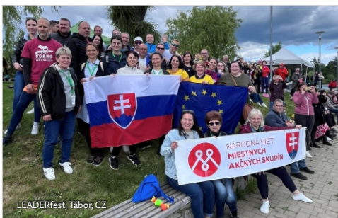
LEADERfest, Tábor, CZ