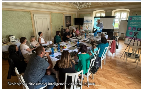
Školenie Využitie umelej inteligencie v riadení, Jelšava