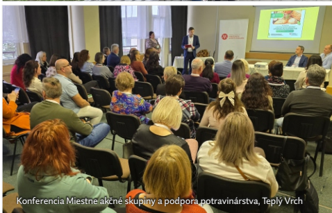
Konferencia Miestne akčné skupiny a podpora potravinárstva, Teplý Vrch