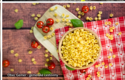
Obec Gemer - gemerské cestoviny