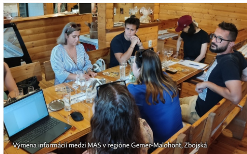
Výmena informácií medzi MAS v regióne Gemer-Malohont, Zbojská