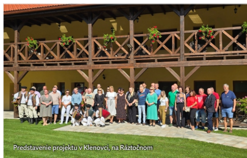
Predstavenie projektu v Klenovci, na Ráztočnom