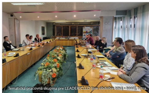
Tematická pracovná skupina pre LEADER/CLLD (pre obdobie 2014 – 2022), Nitra

V roku 2025 sa uskutočňovali pravidelné stretnutia s partnerskými miestnymi akčnými skupinami Partnerstvo Muránska planina – Čierny Hron, VSP Stredný Gemer, VSP Južný Gemer, MAS Cerovina a s Oblastnou organizáciou cestovného ruchu GEMER, ktoré boli zamerané na výmenu skúseností, koordináciu postupov a ďalšie smerovanie rozvoja regionálnej značky GEMER-MALOHONT.