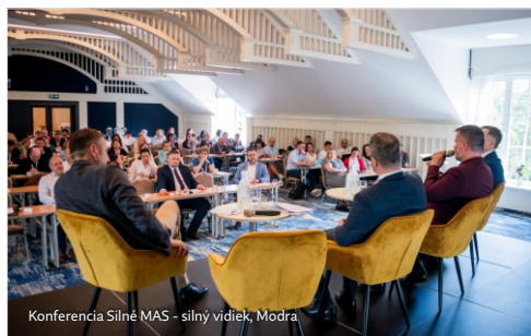
Konferencia Silné MAS - silný vidiek, Modra