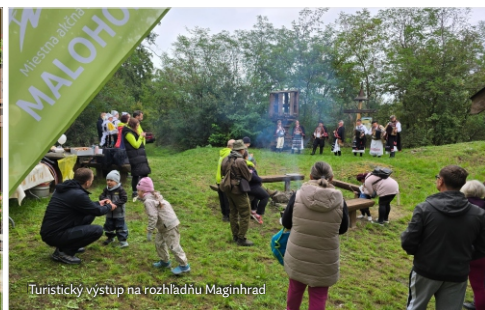
Turistický výstup na rozhľadňu Maginhrad