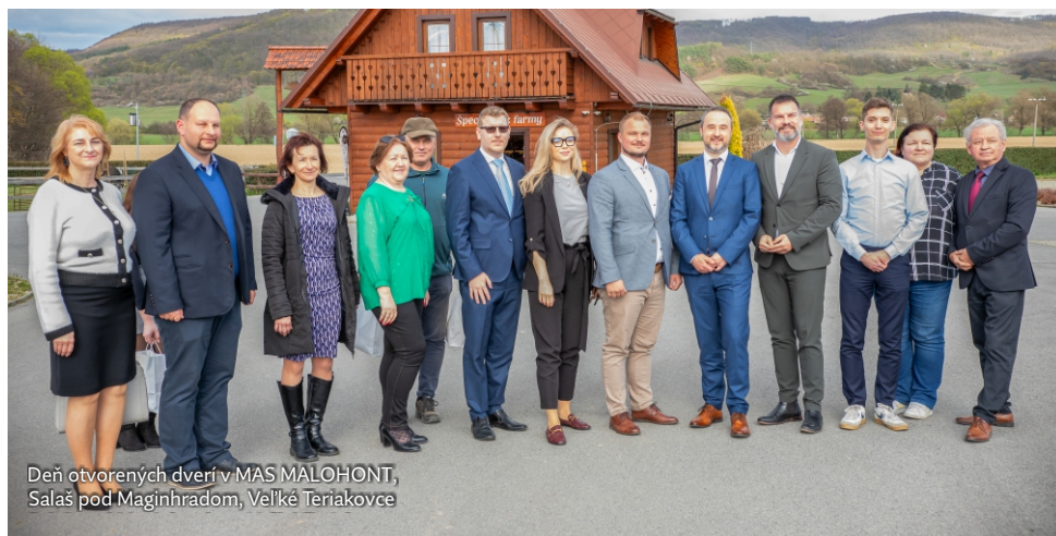
Deň otvorených dverí v MAS MALOHONT, Salaš pod Maginhradom, Veľké Teriakovce