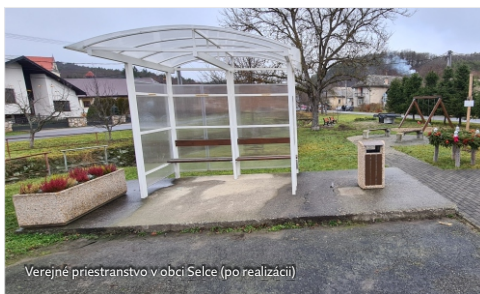
Verejné priestranstvo v obci Selce (po realizácii)