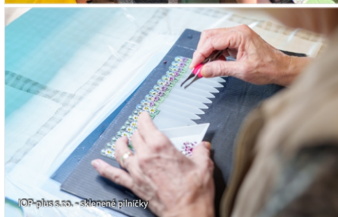
IOP-plus s.r.o. - sklenené piňičky