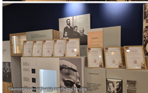
Slávnostné odovzdávanie certifikátov, Hnúšťa