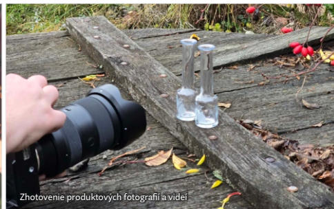
Zhotovenie produktových fotografií a videí