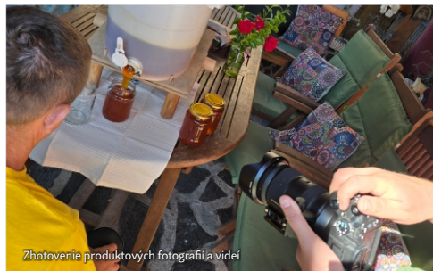
Zhotovenie produktových fotografií a videí