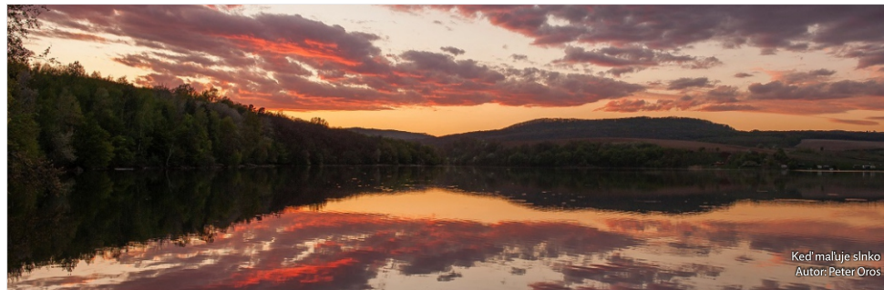
Keď maľuje slnko Autor: Peter Oros