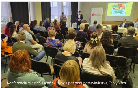
Konferencia Miestne akčné skupiny a podpora potravinárstva, Teplý Vrch