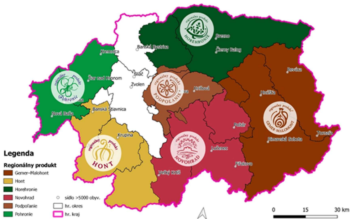
Značky regionálnych produktov v Banskobystrickom samosprávnom kraji v roku 2019

Označenie lokálnych produktov značkou garantuje pôvod produktov v regióne, vysoký podiel ručnej (remeselnej) práce, ako aj ďalšie prínosy produktu aj jeho producenta/výrobca/poskytovateľa služby k rozvoju regiónu, uchovávaníu jeho tradícií v oblasti remesiel a poľnohospodárskej produkcie.