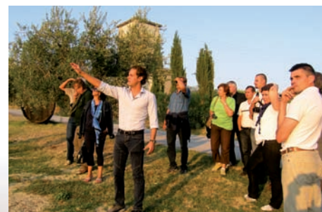
Účasť na exkurzii v Taliansku - prehliadka farmy Guerrieri v Piagge

K pravidelným aktivitám MAS patria aj propagačné podujatia, ktoré MAS organizuje a výstavy, ktorých sa zúčastňuje v spolupráci s členmi a dobrovoľníkmi MAS. Cieľom týchto aktivít je priblížiť aktivity MAS širokej verejnosti a prezentovať jej územie prostredníctvom miestnych produktov, ponuky cestovného ruchu a ľudovej kultúry. Už tradične môžete zástupcov MAS stretnúť vo Dvore MAS na folklórnych festivaloch v Klenovci, Kokave nad Rim. a v Drienčanoch.