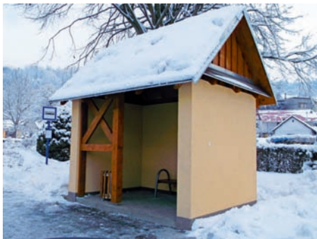
Obec Rimavské Zalužany: Kultúrne - spoločenské centrum v prírode „Lesík“ Finančný príspevok: 28 668,82 EUR

Projekt obce Rimavské Zalužany sa týkal rekonštrukcie areálu v blízkosti obce, nazývaného Lesík, ktorý sa na rôzne kultúrne a spoločenské podujatia využíva už viac ako 80 rokov. Rekonštrukcia zahŕňala v tejto fáze projektu spevnenie svahu, vybudovanie guľášoviska a amfiteátra, ktorý bol začiatkom septembra 2012 „odskúšaný“ vystúpením Folklórneho súboru Vepor z Klenovca počas tradičnej hasičskej súťaže Memorიალ Milana Haviernika.