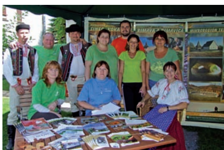
Časť dobrovoľníkov vo Dvore MAS v Drienčanoch v roku 2011

K zvýšeniu informovanosti o aktivitách, území a stratégii MAS vydáva MAS propagačné a informačné materiály, ktoré sú distribuované nielen medzi členov a obce MAS, ale aj účastníkov uvedených podujatí. Od roku 2009 vydala MAS Mapu regiónu Malohont, prezentačné bannery a letáky o Gotickej ceste, náučných chodníkoch a vodných mlynoch na území MAS, prezentačné CD ľudových piesní a rôzne propagačné predmety ako perá, tašky, hrnčeky, kľúčenky a pod. Každý rok vydáva aj Výročnú správu MAS a Kalendár podujatí, ku ktorým od tohto roku pribudnú aj dve čísla novín ročne.