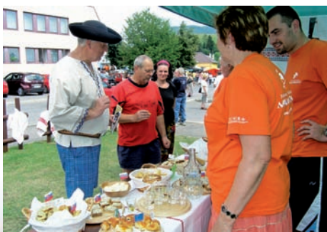
Dvor MAS na Kolesku v Kokave nad Rimavicou v roku 2012