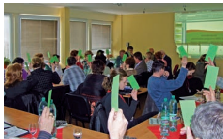
Zhromaždenie členov MAS v Hnúšti v roku 2010

K decembru 2012 mala MAS MALOHONT 53 členov, z ktorých 23 zastupovalo verejný sektor (obce, mikroregióny, školy), 13 členov bolo za súkromný sektor (podnikateľské subjekty) a 17 členov reprezentovalo občiansky sektor (občianske združenia a aktívni občania). Pomerné zastúpenie všetkých sektorov je dodržané vo všetkých orgánoch MAS ako Výbor MAS, Výberová komisia, Monitorovací výbor a Dozorná rada, kde MAS MALOHONT navyše dodržiava aj pomerné geografické