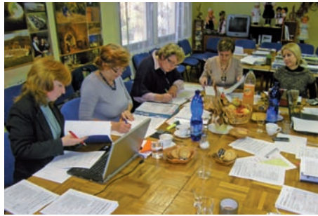
Hodnotenie a výber projektov Výberovou komisiou MAS

O schválení, resp. neschválení projektov obcí a podnikateľov rozhoduje na základe bodovacích kritérií 7- členná Výberová komisia MAS, v ktorej má svoje zastúpenie verejný, súkromný i občiansky sektor. Posledné slovo v hodnotení má však Pôdohospodárska platobná agentúra (PPA), ktorá vykonáva následnú administratívnu kontrolu projektov.