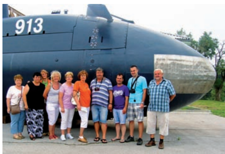
Účastníci exkurzie v Slovinsku - v areáli Múzea vojenskej histórie v obci Pivka

K zvýšeniu informovanosti o aktivitách, území a stratégii MAS vydáva MAS propagačné a informačné materiály, ktoré sú distribuované nielen medzi členov a obce MAS, ale aj účastníkov uvedených podujatí. Od roku 2009 vydala MAS Mapu regiónu Malohont, prezentačné bannery a letáky o Gotickej ceste, náučných chodníkoch a vodných mlynoch na území MAS, prezentačné CD ľudových piesní a rôzne propagačné predmety ako perá, tašky, hrnčeky, kľúčenky a pod. Každý rok vydáva aj Výročnú správu MAS a Kalendár podujatí, ku ktorým od tohto roku pribudnú aj dve čísla novín ročne.