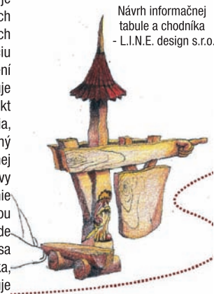
Návrh informačnej tabule a chodníka - L.I.N.E. design s.r.o.

V súčasnosti je už predložených niekoľko menších projektov na realizáciu niektorých zastavení chodníka a pripravuje sa jeden väčší projekt na zvyšné zastavenia, ktorý bude predložený do poslednej plánovanej výzvy MAS na predkladanie projektov. Realizáciou týchto projektov bude vybudovaná celá trasa náučného chodníka, ktorý sprostredkuje návštevníkom históriu a krásy nášho regiónu a tajomná povesť o Maginhrade tak nezapadne prachom, ale zachová sa v zaujímavej podobe aj pre ďalšie generácie. Projekt na zhotovenie projektovej dokumentácie náučného chodníka bol podporený Environmentálnym fondom v rámci Programu obnovy dediny v roku 2012. Mikroregión je členom MAS MALOHONT od jej založenia v roku 2007.