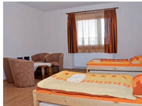
Obec Španie Pole: Vidiek ožije, ale pomôžeme mu! Finančný príspevok: 8 293,50 EUR

Obec Španie Pole vybudovala v rámci projektu detské ihrisko s preliezkou, hojdačkou a šmýkalkou, ako aj autobusovú zastávku, ktorá dovtedy v obci vôbec nebola