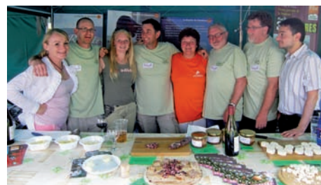
Animačné podujatia vo Francúzsku (hore) a na Slovensku (dole)