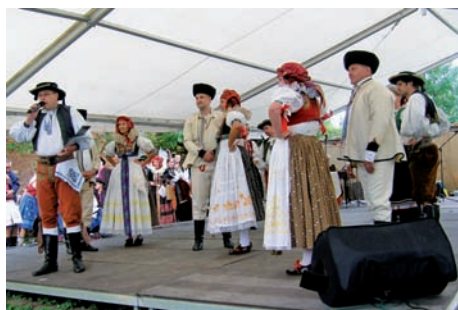
Animačné podujatia v Dřevohosticiach a Příkazoch v ČR