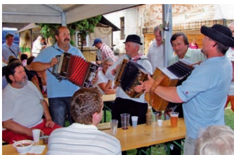
Veselo vo Dvore MAS na Klenovskej rontouke v Klenovci v roku 2012