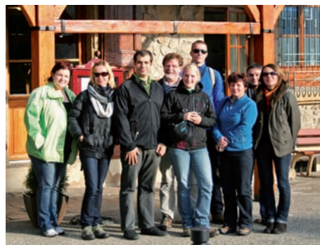
Poľnohospodári a pracovníci slovenských MAS vo Francúzsku

V novembri sa potom konal pobyt 4 poľnohospodárov a 2 pracovníkov z MAS MALOHONT a Podpoľanie na francúzskych farmách, ktorý nadviazoval na návštevu farmárov z MAS Pilat na farmách v slovenských MAS v marci 2011. Účastníci tejto aktivity sa priamo na viacerých farmách oboznámili so spôsobom výroby a predaja miestnych produktov, s ich značením, ako aj s úlohou farmárov a miestnych produktov v cestovnom ruchu.