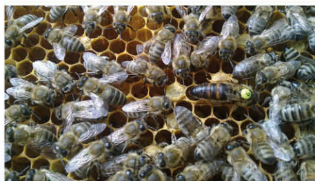
Živnostník je členom MAS MALOHONT od jej založenia v roku 2007.