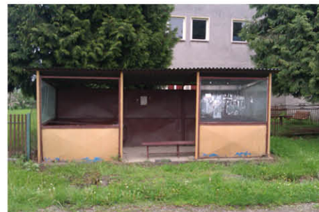
Pôvodná autobusová zastávka v H. Zahoranoch zo začiatku roka 2013 je už minulosťou

V rámci 6 projektov obcí, ktoré boli v grantovom programe podporené sumou 8 300,- EUR, bola zrekonštruovaná autobusová zastávka v Horných Zahoranoch, vybudovaná oddychová zóna v obci Šoftýska a altánok v obci Potok. Okrem toho bola v obci Kociha upravená časť koryta vodného toku pri obecnom úrade, v Dražiciach bolo skrášlené verejné priestranstvo s informačnými tabuľkami a v obci Slizké bol zastrešený prameň pitnej vody.