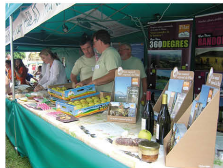
Ochutnávka produktov z francúzskej MAS Pílat na Klenovskej rontouke v roku 2012 v rámci projektu spolupráce

Realizácia stratégie rozvoja územia MAS vyvrcholila v tomto roku predložením 26 projektov obcí a podnikateľov v 7 výzvach na predkladanie projektov, ako aj realizáciou ďalších projektov podporených v predchádzajúcich rokoch. Zároveň došlo k zmene v stratégii, ktorá spočívala v doplnení podporovaných opatrení a aktivít, vďaka čomu sa podarilo prerozdeliť 100 % podpory, ktorá bola schválená v roku 2009. Okrem toho boli predložené ďalšie 3 projekty národnej i nadnárodnej spolupráce a v grantovom programe bolo okrem 8 projektov občianskych združení podporených aj 6 projektov malých obcí. Aj tento rok významnú časť aktivít MAS predstavovala propagácia MAS prostredníctvom vlastného dvora na folklórnych podujatiach v Klenovci, Drienčanoch a v Kokave nad Rimavicou.