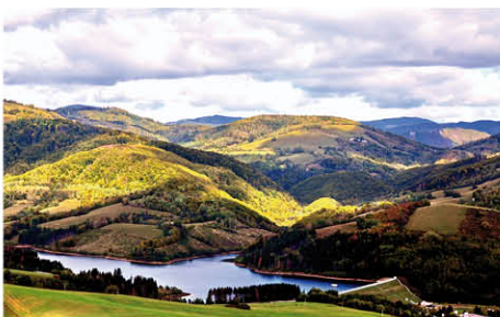
Klenovská priehrada 2. miesto v kategórii Naša príroda