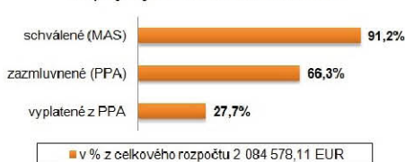
Prehľad čerpania financií z PRV SR 2007 - 2013 na projekty v území MAS k 30.09.2013

Z celkového rozpočtu vo výške 2 084 578,11 EUR bolo ku koncu septembra 2013 na základe žiadostí o platbu a kontroly na mieste vyplatených 578 006,00 EUR na 16 projektov, čo predstavuje celkové čerpanie 27,7 %. K tejto sume prispeli a prispeli vlastným vkladom aj obce a podnikateľské subjekty, ktorých projekty boli schválené a zrealizované, resp. budú zrealizované v rokoch 2010 - 2015.