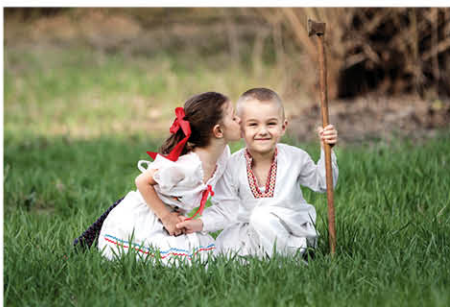
Číše si šuhajko, čiže si - Foto: Petra Rapčanová 2. miesto v kategórii Naša budúcnosť