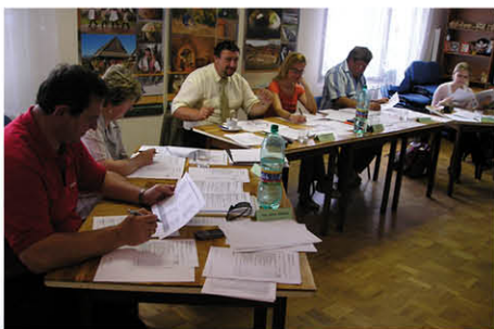
Hodnotenie projektov v grantovom programe MAS v r. 2008

Spracovanie stratégie rozvoja územia MAS vyvrcholilo v decembri 2008, kedy bola predložená na Pôdohospodársku platobnú agentúru. Tomu predchádzalo informovanie obecných zastupiteľstiev o jej obsahu a význame pre rozvoj územia MAS. Realizáciu aktivít na princípoch prístupu LEADER „v malom“ si zástupcovia MAS odskúšali na grantovom programe, ktorý spolufinancovali mikroregióny zahnuté do územia MAS. Sumou 5 261 EUR bolo vtedy podporených 17 malých projektov obcí, občianskych združení a podnikateľov. Okruh spolupracujúcich partnerov sa v roku 2008 rozšíril o MAS Pílat z Francúzska a popri propagačných podujatiach bolo významným krokom v informovanosti a propagácii MAS vytvorenie a spustenie web stránky MAS.