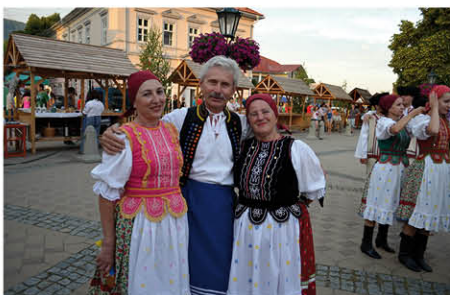
Pred vystúpením na Klen. rontouke - 3. miesto v kategórii Život v našej MAS