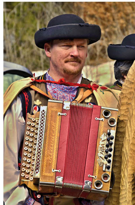
Heligonkár FS Vepor z Klenovca 3. miesto v kategórii Naše tradície

Na túto otázku odpoviem jednoducho. Ak Vás táto práca baví, môže sa stať Vaším povoláním. Pre veľký záujem o moju prácu, za ktorú sú ľudia ochotní zaplatiť, som v podstate ani nemala na výber. Pracovať v tomto obore nelegálne by bolo totiž riskantné. Určite musím oveľa viac pracovať, ako keby som bola zamestnanec inej firmy. Všetko od nápadov až po realizáciu je len na mne. Nevieť, kde skončím, ale zatiaľ sa stále posúvam ďalej, učím sa nové veci, získavam nové skúsenosti. Keby som sa mala rozhodnúť znovu, rozhodla by som sa rovnako.