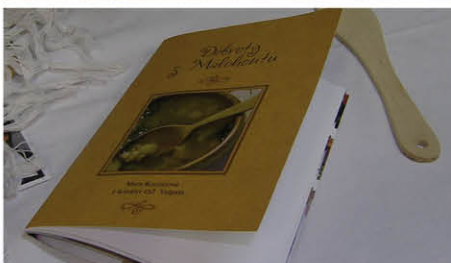
Občianske združenie je členom MAS MALOHONT od jej založenia v roku 2007.