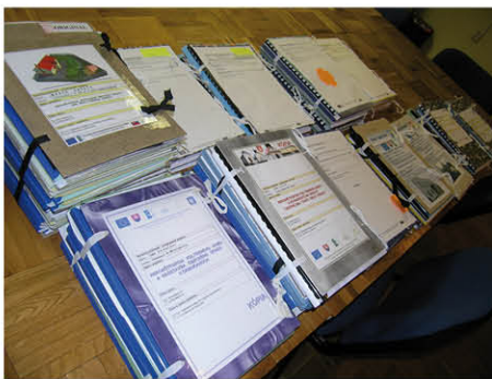
Prvé projekty predložené vo výzvach MAS v roku 2010

Realizácia stratégie rozvoja pokračovala 3 výzvami na predkladanie projektov, v ktorých bolo dokopy prijatých 20 projektov obcí a podnikateľov. Boli zazmluvnené a zrealizované ďalšie projekty schválené v rokoch 2010 - 2011, ako aj grantový program MAS, v ktorom bolo sumou 16 600 EUR podporených ďalších 13 malých projektov predovšetkým občianskych združení. V tomto roku boli vypracované a schválené aj 2 projekty nadnárodnej spolupráce so slovenskou, francúzskou a českými MAS. Nechýbali ani vzdelávacie a informačné aktivity, ktorých sa zúčastnilo 213 účastníkov a odborné exkurzie v Rakúsku, Taliansku a Poľsku za účasti zástupcov MAS.